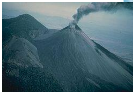
Vista aérea del desastre ocasionado por la tormenta Agatha en su paso por Guatemala y del Volcán de Pacaya en erupción.